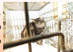
Crevette, premier chat stérilisé

Nous rappelons que la stérilisation des chats domestiques relève de leurs propriétaires.