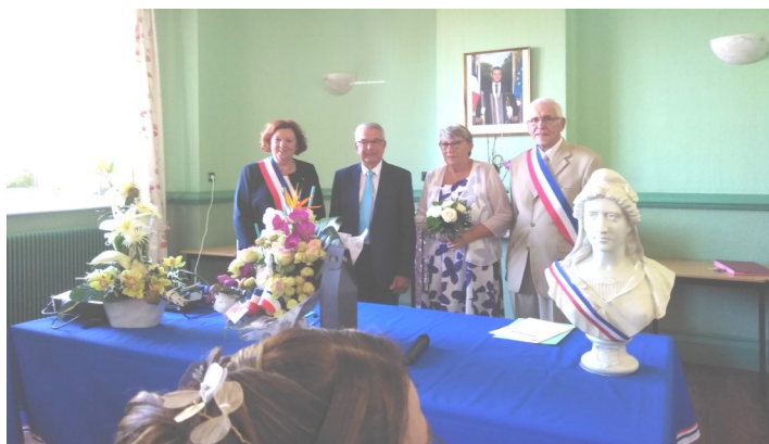
Nos meilleurs vœux de bonheur aux mariés.