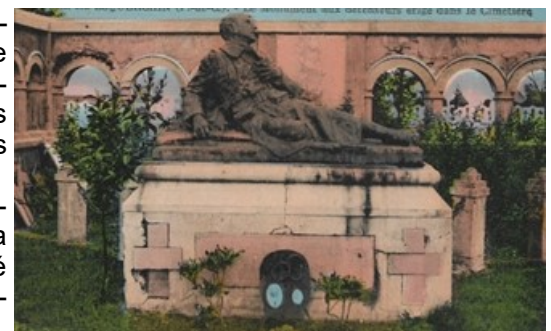
Carte postale éditée en 1934 représentant le Monument aux Défenseurs dans sa conception d'origine.

Le « Poilu mourant » est l'œuvre du sculpteur lillois Jules Dechin et représente le sacrifice des héros morts pour la France. Finement réalisé par la célèbre fonderie d'Antoine Durenne en Haute Marne, cette œuvre a été choisie par plus de 300 communes françaises pour symboliser leur monument aux morts.