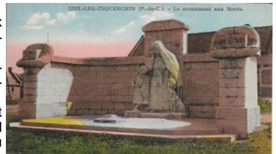
Carte postale éditée en 1934 représentant le Monument aux Morts à sa réception provisoire (il est inachevé).

La présence surprenante d'un chien, très rare, aux côtés de la veuve et de l'orpheline, exprime la fidélité envers le maître et dans son regard triste, se lit sa détresse après la perte de l'ami. Magnifique symbole du dévouement et de l'attachement qui unit des hommes et des animaux liés dans la boue des tranchées.