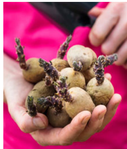
Plantez les pommes de terre avant la fin des dernières gelées et jusqu'en mai.